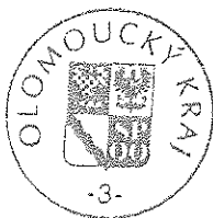
Ing. Zdeněk Švec náměstek hejtmana Olomouckého kraje